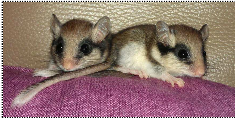
Foto: Eikelmuisjes die hun pootjes strekken.

Er werd een konijnenhok gekocht en met de hulp van mijn vader een klein beetje verbouwingen gedaan, nl een heel fijne traliesdraad (0,5cm 2 ) tegen aan gemonteerd. En hun nieuwe thuis (eikelmuiskast) werd erin geplaatst. Ik had hun bestaande nest erin geplaatst, zodat ze toch hun eigen geur herkenden.