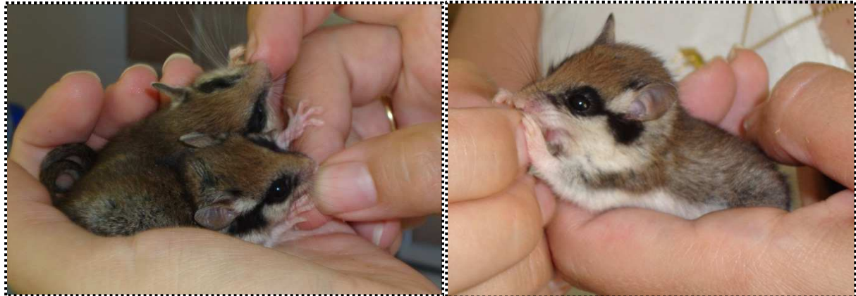
Foto: Vleeswormen leegzuigen.

Doordat ik ontdekt had dat de muisjes nog een zuigreflex hadden, zijn we naar de viswinkel getrokken om vleeswormen. Deze sneed ik dan de kop af. En de muisjes kwamen erop af alsof ze de tepel van hun moeder gevonden hadden.