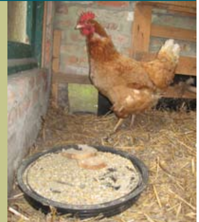
Teveel eten in het kippenhok trekt ratten aan

Ratten hebben nieuwvrees en zijn vaak moeilijk te vangen met klemmen of vallen. Als er één dier gevangen werd, komen de andere er meestal niet meer in de buurt. Bij haarden van meerdere ratten is het gebruik van gif helaas soms niet te vermijden. Het is dan ook heel belangrijk dat dit op een verantwoorde manier gebeurt. Gifstoffen van de eerste generatie (bv. Warfarine, Chlorofacinon, Difacinon en Coumatetralyl) breken het snelst af in de natuur, zodat de kans vrij klein is dat het gif andere slachtoffers maakt. Helaas zijn sommige populaties (vooral in afgesloten systemen zoals bedrijven) resistent hiertegen en zijn dan sterkere gifstoffen nodig. Giffen van de tweede generatie (bv. Bromadiolone, Difenacoum) breken minder snel af en derde-generatie gifstoffen (bv. Brodifacoum, Difethialone) breken zeer slecht af. Deze zijn dus te vermijden. Overdrijf zeker niet met de hoeveelheden gif die je uitlegt (leg pas nieuw gif als het vorige op is). Plaats het gif zo dat andere dieren of kinderen er niet bij kunnen. Rattenbakken zijn hiervoor het meest geschikt. In geval van een echte plaag contacteer je best je gemeentebestuur. En ook hier weer geldt dat curatieve maatregelen weinig zin hebben zonder preventieve maatregelen.